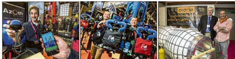
De g. à d.: Azoth propose un système de capteurs permettant une décompression parfaite. Le Triton installé dans le Var propose le premier recycleur "loisirs" ventral 100% made in France. Tech Plus a mis au point le premier caisson hyperbare gonflable, pliable, mobile et autonome.