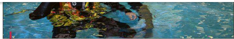
Avec ce 20 e Salon de la plongée, c'est l'occasion pour des entreprises de la région de présenter des produits innovants.